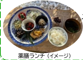
薬膳ランチ (イメージ)